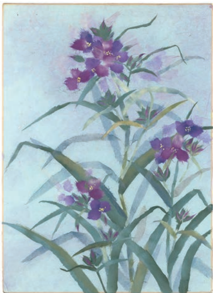
ちぎり絵「つゆ草」関口己佐子